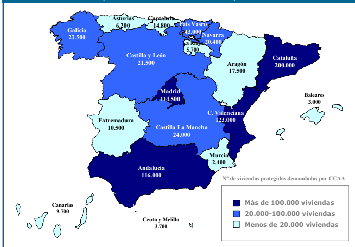
Mapa 1: Demanda de vivienda social por CCAA.